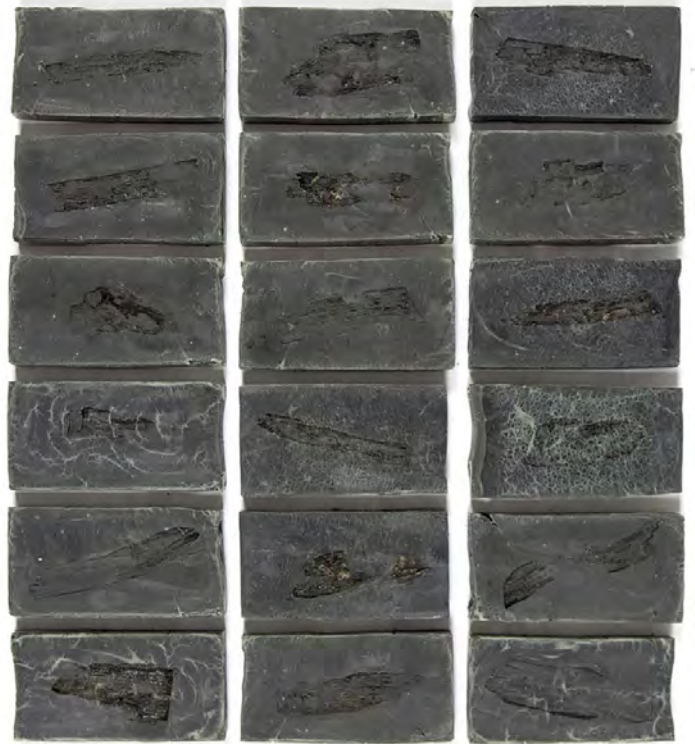
1 MARCO BRUZZONE, Untitled (Glub-Club, Bag Sign), 2022, acrylic on canvas, 264 x 215 cm