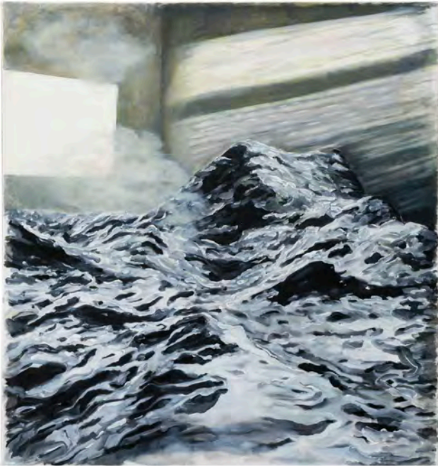
SARAH KIRSCH, Love Poem , 2023, 99 x 92 cm, Acryl auf canvas